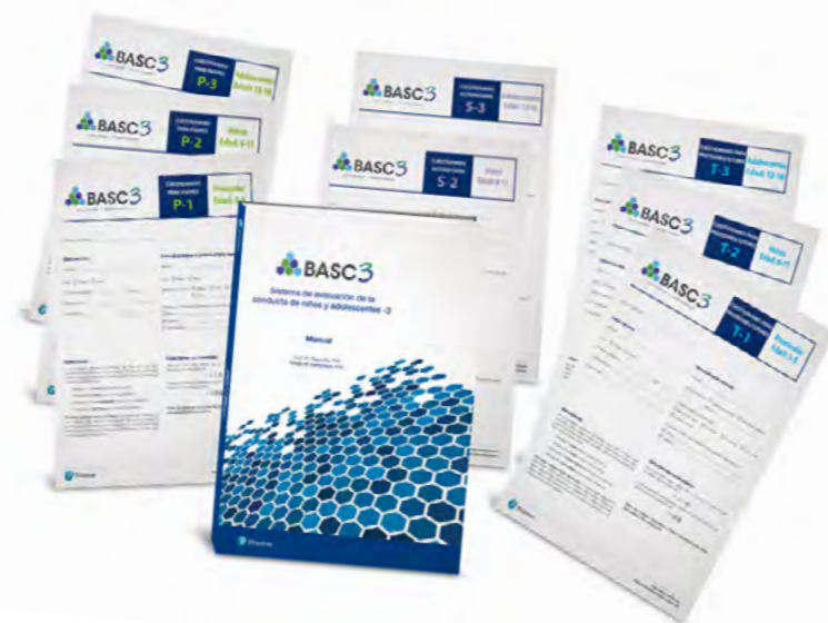
Imagen no contractual